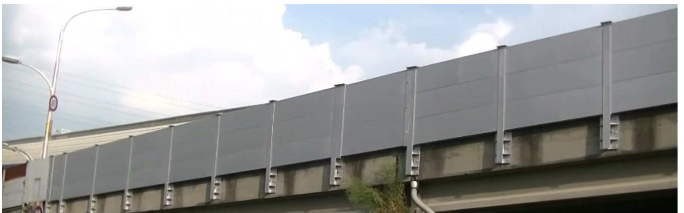
2日間で完成(今回、高所作業車2台使用できれば1日塗装完了も実現可能)